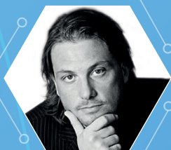
PAOLO BARBERIS Consigliere per l'Innovazione del Presidente del Consiglio dei Ministri