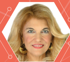
STELLA PENDE Giornalista Mediaset