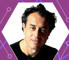
MATTEO GARRONE Regista