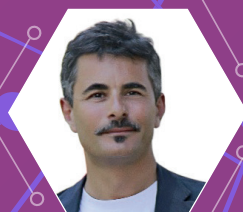
PAOLO GENOVESE Regista