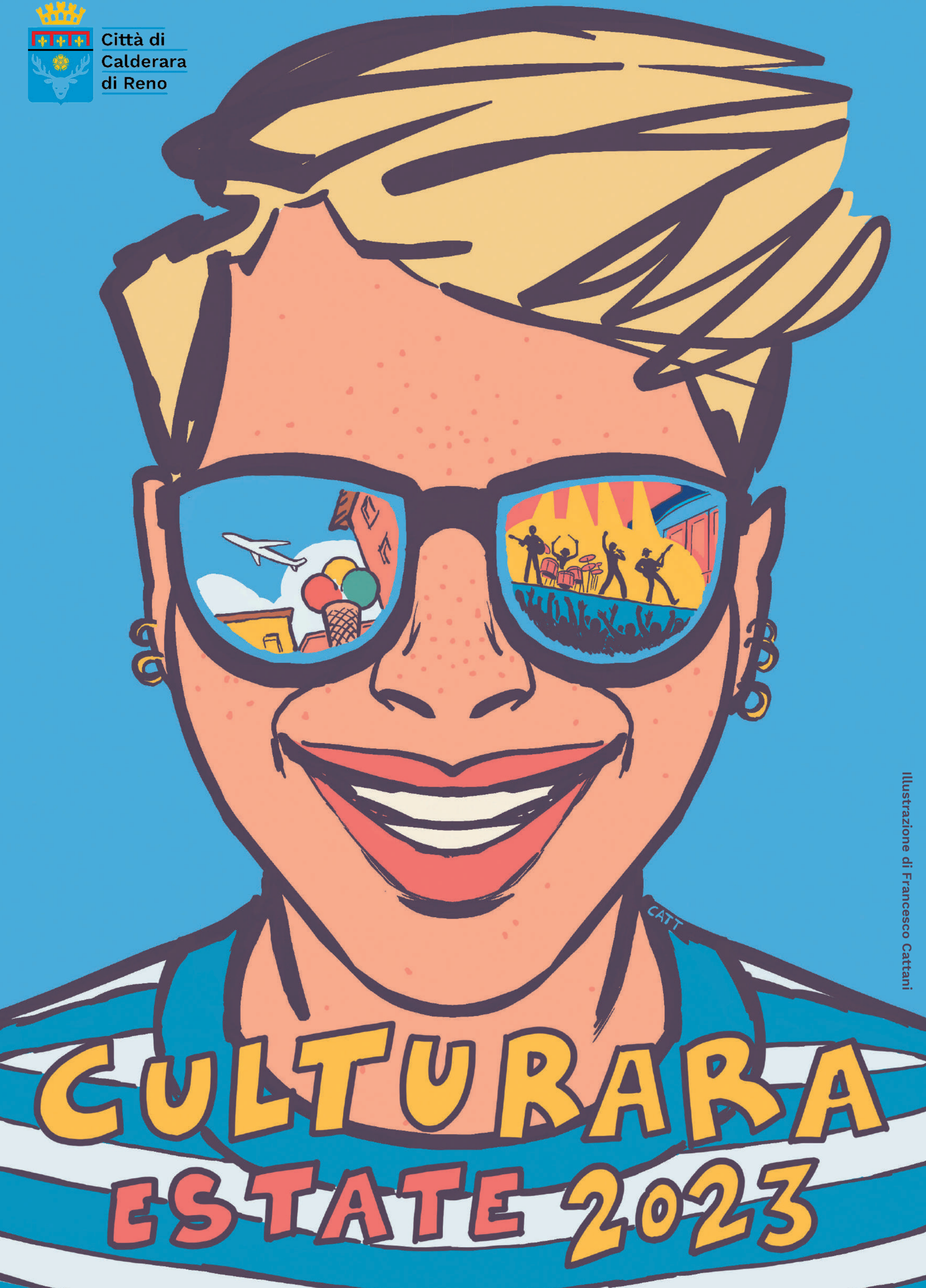
Illustrazione di Francesco Cattani